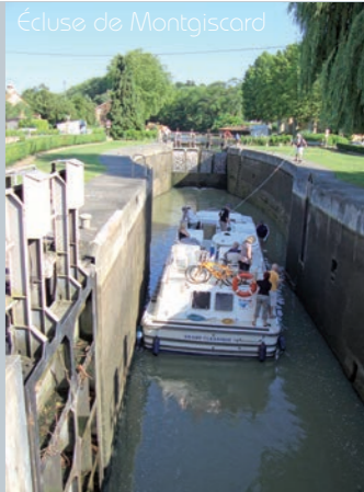
Écluse de Montgiscard

Enfin, Montgiscard permet de rejoindre facilement le bassin d'emplois de Labège Enova : ce pôle d'activités regorge d'entreprises et de campus tournés vers l'innovation et le numérique. De plus, le lieu accueillera à terme la 3ème ligne de métro, dès 2025. À 15 minutes en voiture, le Centre National d'Études Spatiales (CNES) et l'Institut National de Recherche Agronomique (INRA) font également partis des zones d'emplois proches.