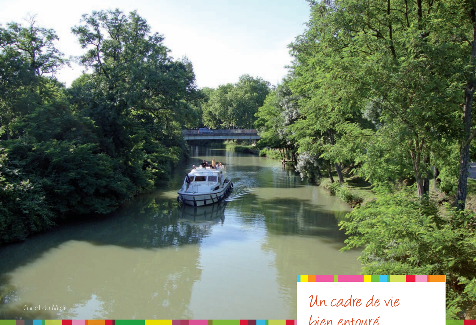
Canal du Midi