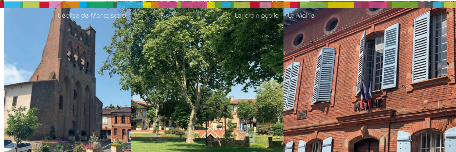
L'église de Montgiscard

Enfin, Montgiscard permet de rejoindre facilement le bassin d'emplois de Labège Enova : ce pôle d'activités regorge d'entreprises et de campus tournés vers l'innovation et le numérique. De plus, le lieu accueillera à terme la 3ème ligne de métro, dès 2025. À 15 minutes en voiture, le Centre National d'Études Spatiales (CNES) et l'Institut National de Recherche Agronomique (INRA) font également partis des zones d'emplois proches.