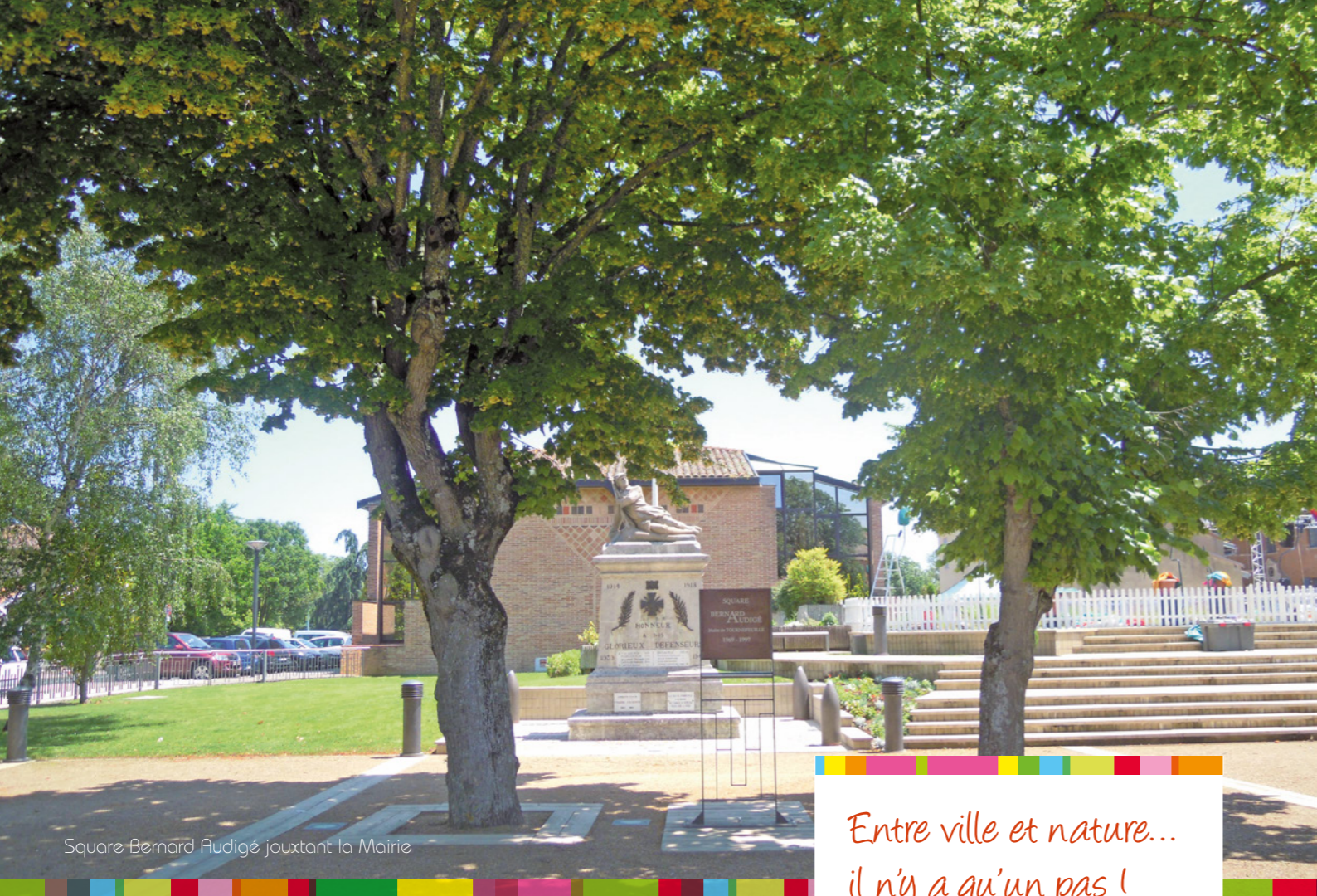
Square Bernard Audigé jouxtant la Mairie

Entre ville et nature... il n'y a qu'un pas !