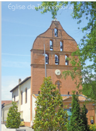
Église de Tournefeuille

proximité avec les bassins d'emplois de l'Aéroconstellation de Blagnac, du parc d'activités technologiques de Basso Cambo et du pôle aéronautique d'Airbus situé à Colomiers et Saint-Martin-du-Touch.