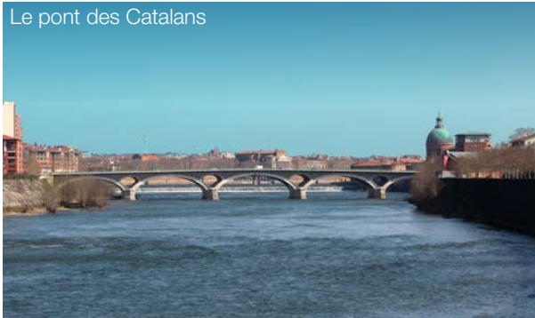
Le pont des Catalans

Bénéficiez d'un tissu de transports en commun complet (tramway, bus, métro, TER), d'un accès direct à la rocade, à l'aéroport international ou au pôle économique de l'ouest toulousain. Profitez des nombreux commerces et services de proximité : crèche, établissements scolaires, écoles d'ingénieurs et d'enseignement supérieur, infrastructures sportives, culturelles (Musée des Abattoirs, Théâtre Garonne) et établissements de santé (CHU de Purpan) sauront accompagner votre quotidien. Pour tous vos instants de détente, les Jardins du Barry et l'Esplanade des sports vous inviteront à voir la vie en vert.