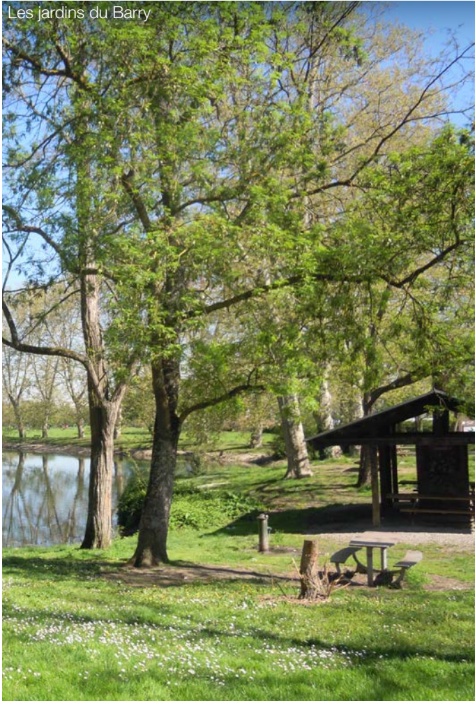
Les jardins du Barry